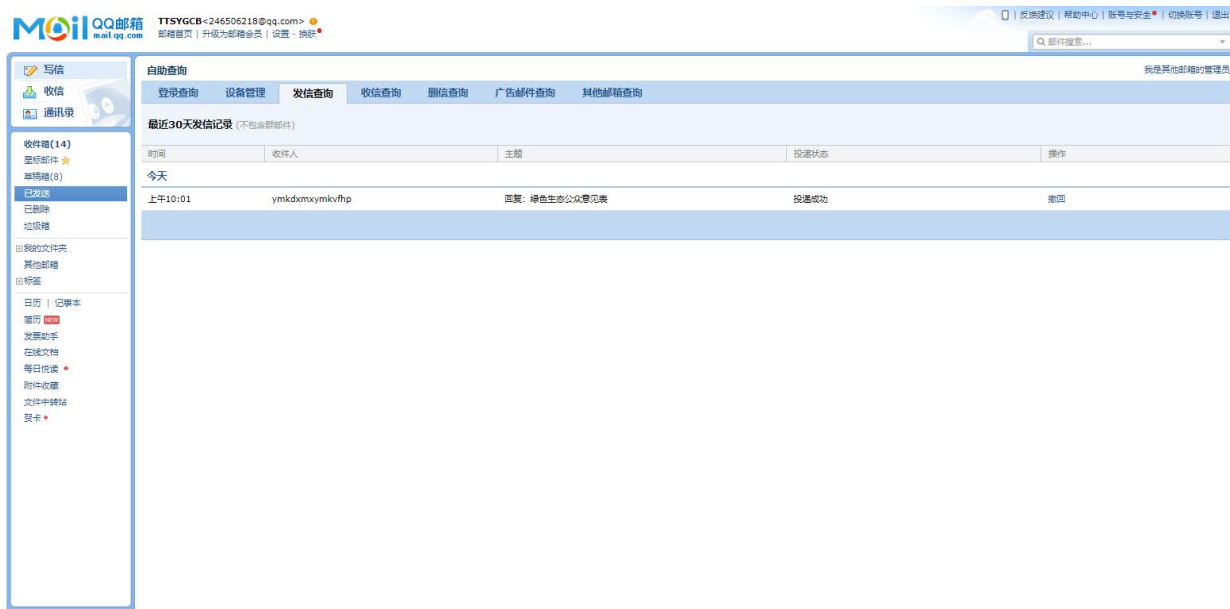
图 5-3 通过电子邮件形式对公众意见予以回复

根据该公众提出的问题和意见，在与可研单位、环评单位深入研究的基础上，我公司于 2024 年 9 月 14 日以电子邮件的形式给予了回复。