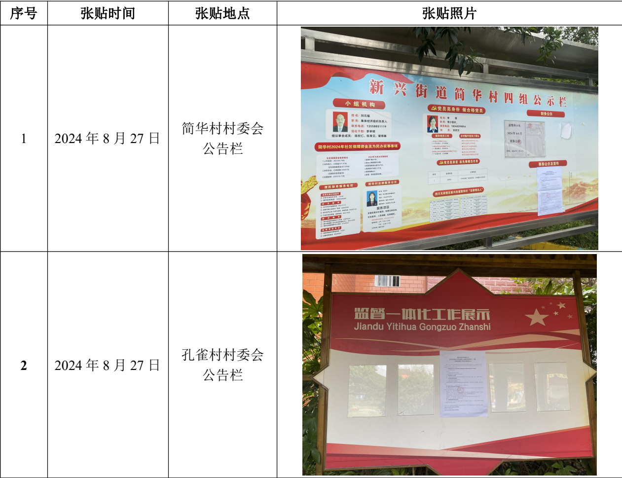
表 3-1 征求意见稿张贴公告情况