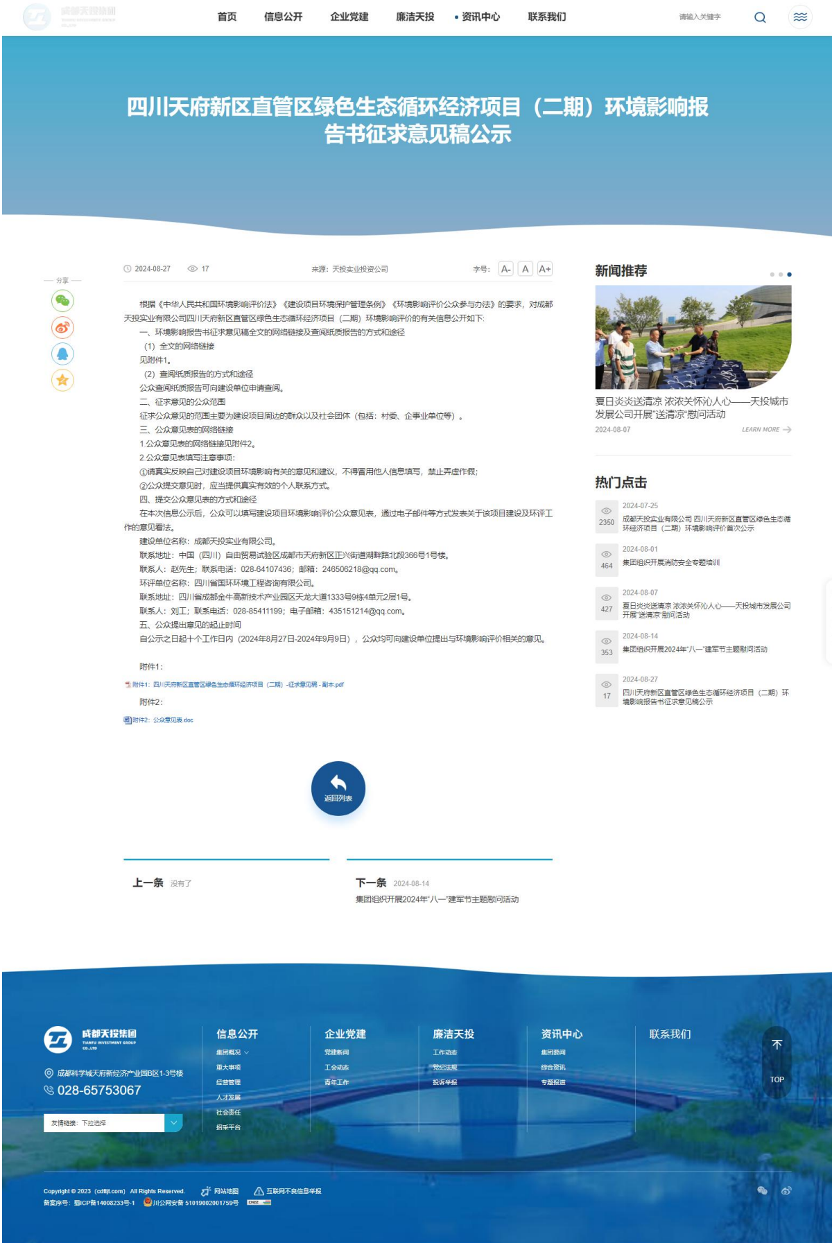
图 3-1 征求意见稿网络公示截图