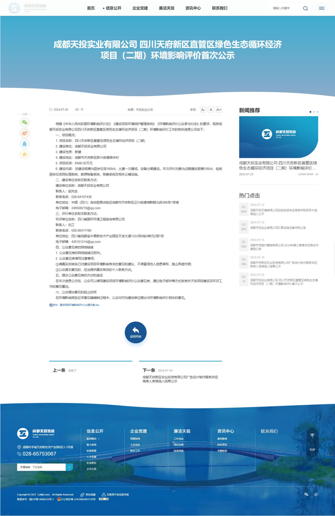
图 2-1 首次环境影响评价信息网络公示截图